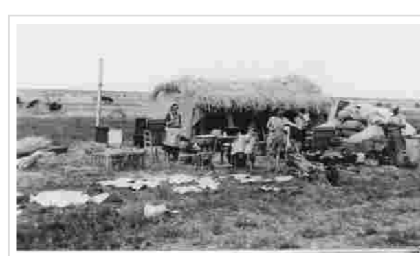
Leben in der Baragan-Steppe

Bitte beachten: Relevante Unterschiede zwischen Renten der Sozialversicherung (pensii asigurari sociale) und Zahlungen von Entschädigungen für politische Verfolgung (Indemnizatii decret 118/1990)